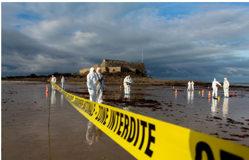
Photo de photographe-de-plateau-meurtres

Ce qu'il faut retenir de l'actualité de la semaine